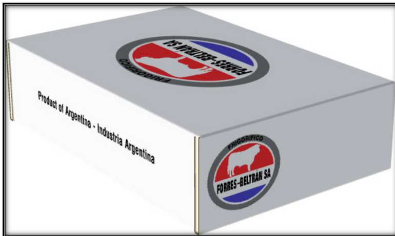
Imágenes meramente ilustrativas / Images only for illustration